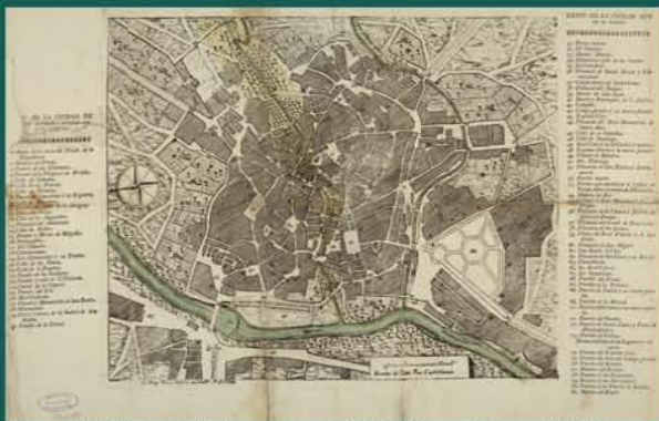
Plano del Valladolid inundado de 1788. Diego Pérez. AMVA.