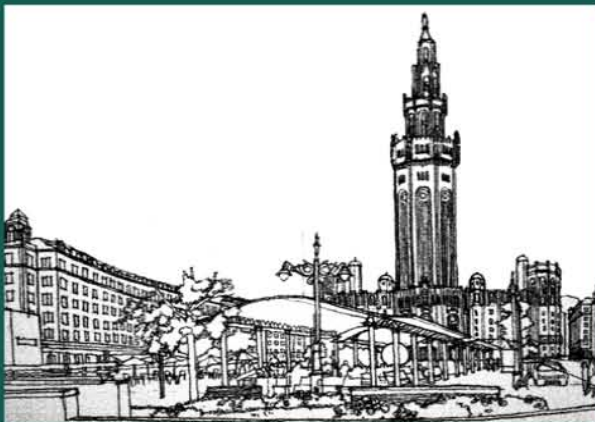
Vista del Alcazar de Cristo Rey desde la Plaza de España. S. Bellido 2011.

Visitas guiadas a la exposición y al archivo: viernes 12:00 h. Información y reservas: Oficina de Turismo, tño. 983 21 93 10