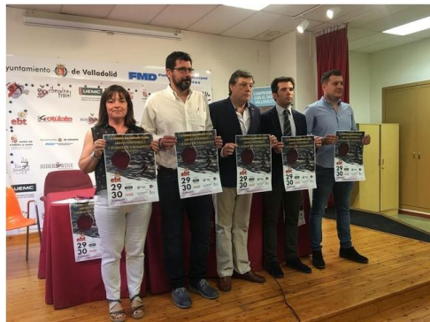
El balonmano playa tiene una cita en las Moreras

17 equipos tomarán parte este fin de semana en el II Torneo de Balonmano Playa Arena "Ciudad de Valladolid"