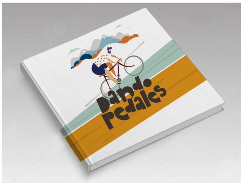
LIBRO DEL RETO Comentarios, reflexiones, fotos, anécdotas... 15 €