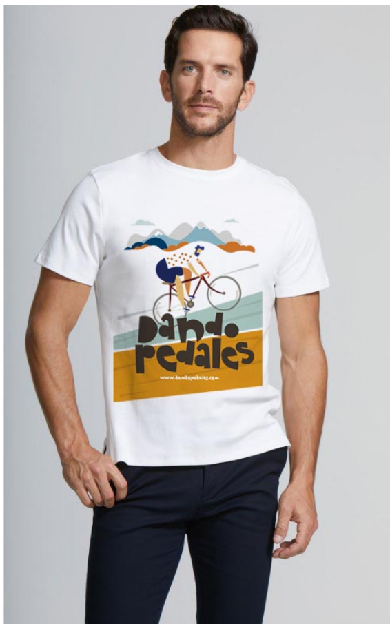
CAMISETA 20 €

Puedes colaborar patrocinando el reto, comprando o donando, desde la web www.dandopedales.com