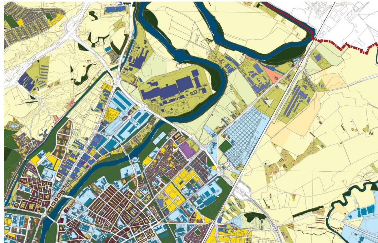
Área industrial norte de la ciudad (en relación con la A-62)

O la deslocalización de empresas dentro de la propia ciudad: Panibérica de Levaduras o Quesos Entrepinares... ubicadas hoy donde la desaparecida NICAS.