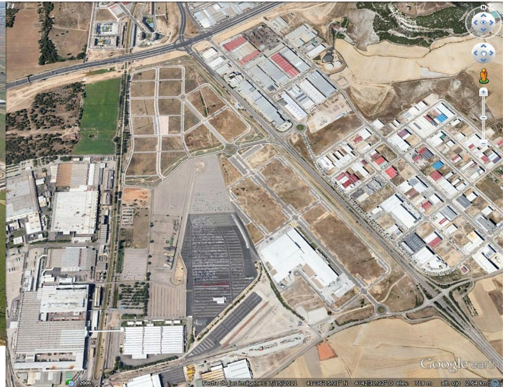
Sector Industrial Jalón