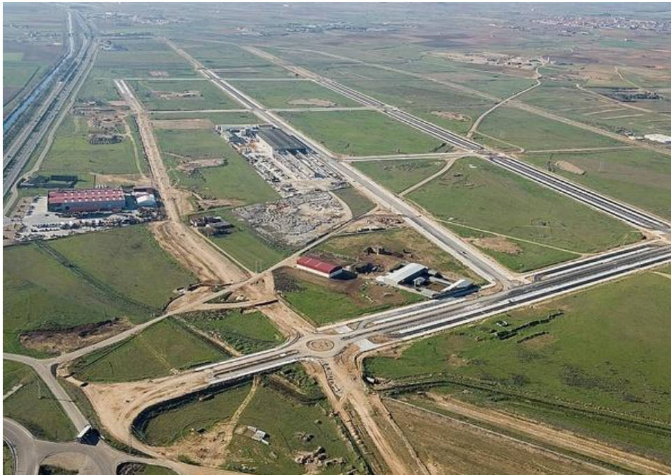
Polígono Canal de Castilla

Necesidad de formular una estrategia industrial compartida en el territorio comarcal.