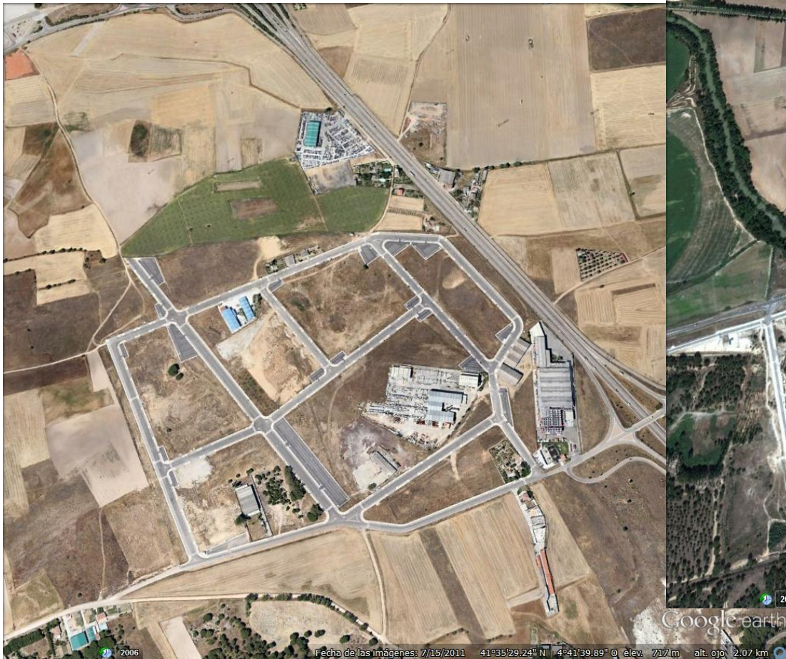
Polígono urbanizado en la carretera de Segovia