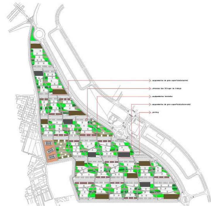
Sector Las Raposas II en planificación actualmente