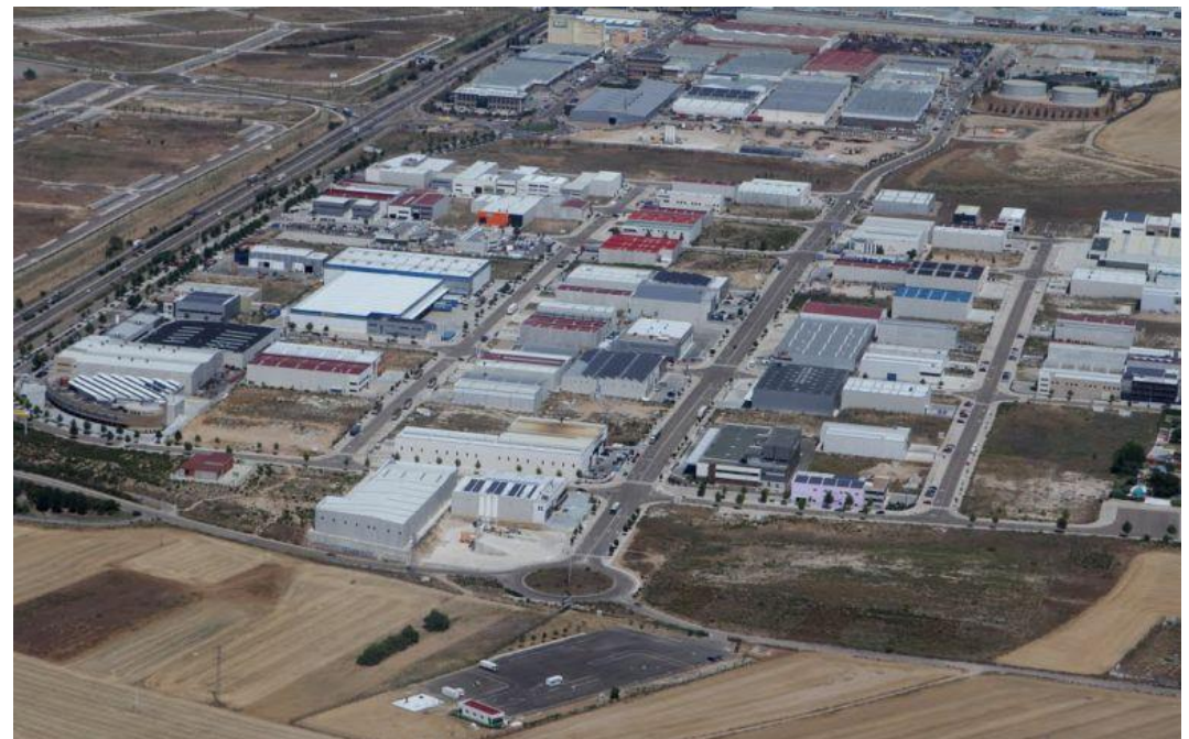
Sector industrial “El Carrascal”