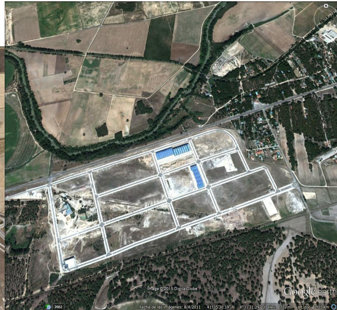
Polígono urbanizado en Tudela de Duero