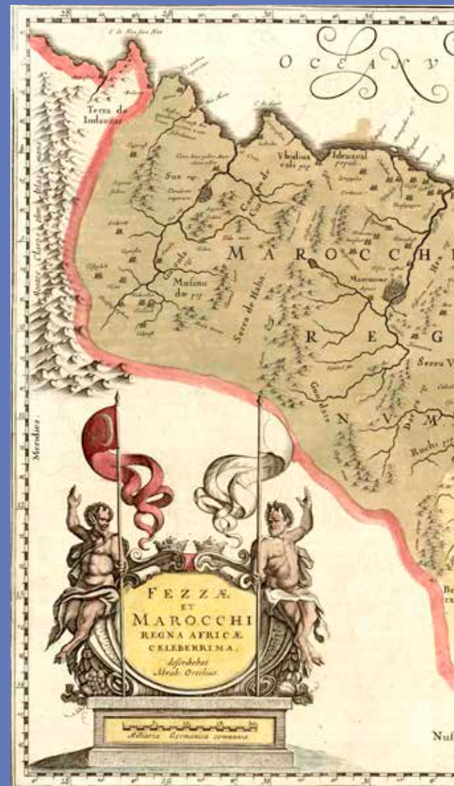
En portada: AMVA PL 4371. Fezzae et Marocchi regna Africae celeberrima Abraham Ortelius. Ámsterdam, 1635; 38,7 x 50,5 cm en una hoja de 50,4 x 60 cm

Archivo Municipal de Valladolid Calle Santo Domingo de Guzmán, n.º 8 tfno. 983 36 38 70