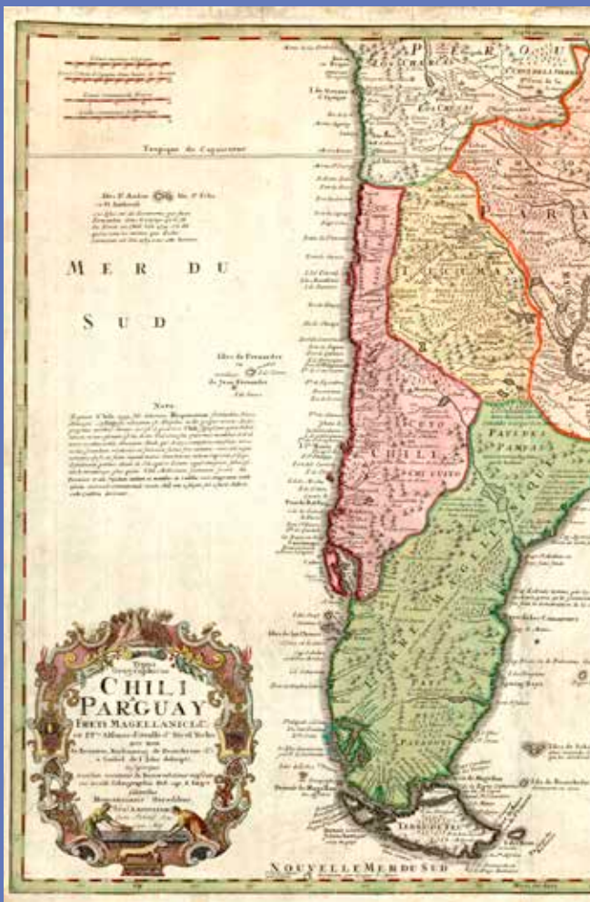
Arriba: AMVA PL 4356. Typus geographicus Chili Paraguay freti Magellanici & c / ex PPb[us] Alfonso d'Ovalle & Nicol. Año 1733. 50,7 x 60,2 cm

La totalidad de estas escuelas están representadas en la colección Rodríguez Torres – Ayuso, y por ende en la donación realizada al Archivo Municipal, de la que esta exposición constituye una muestra significativa. Organizada por ámbitos geográficos, desde las representaciones más generales del universo hasta las representaciones más concretas de Valladolid, pasando por representaciones de Europa, de España y de Castilla, en la exposición están presentes obras de célebres cartógrafos de las escuelas de los Países Bajos (Ortelius, J. Hondius, J. Jansonium, F. de Wit, N. Visscher, Van der Aa), francesa (G.R. de Vaugondy, N. de Fer, E. Mentelle, P.G. Chanlaire), alemana (Von Reilly) y española (T. López, A. Ponz, F. Coello).