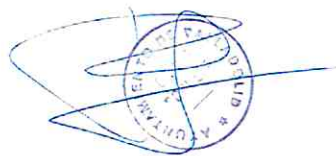
M a Pilar del Olmo Moro Concejal – Presidenta del Grupo Municipal Popular