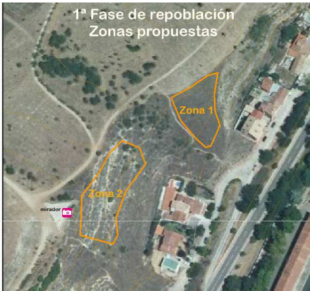
1ª Fase de reforestación. Zona de inicio.