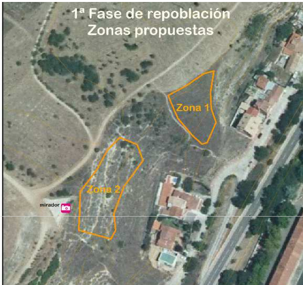
1ª Fase de reforestación. Zona de inicio.