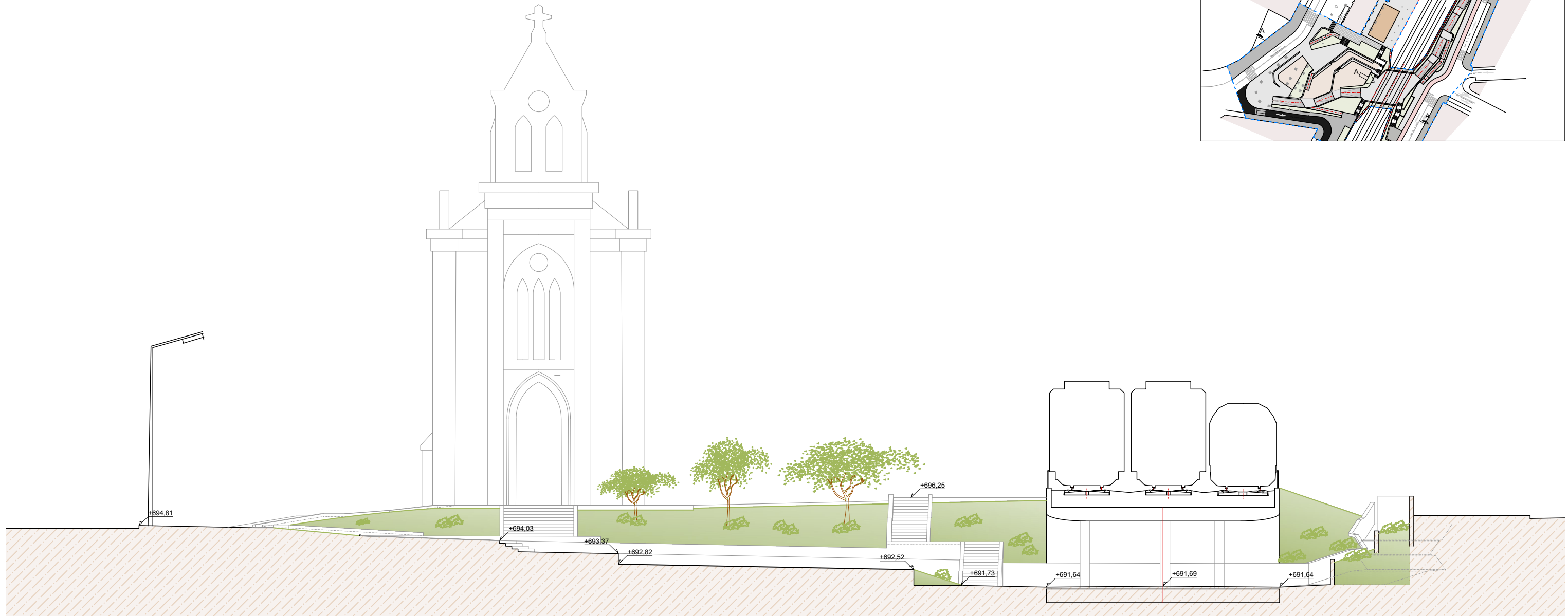
SECCIÓN TRANSVERSAL A-A Escala 1/100 Cotas en m