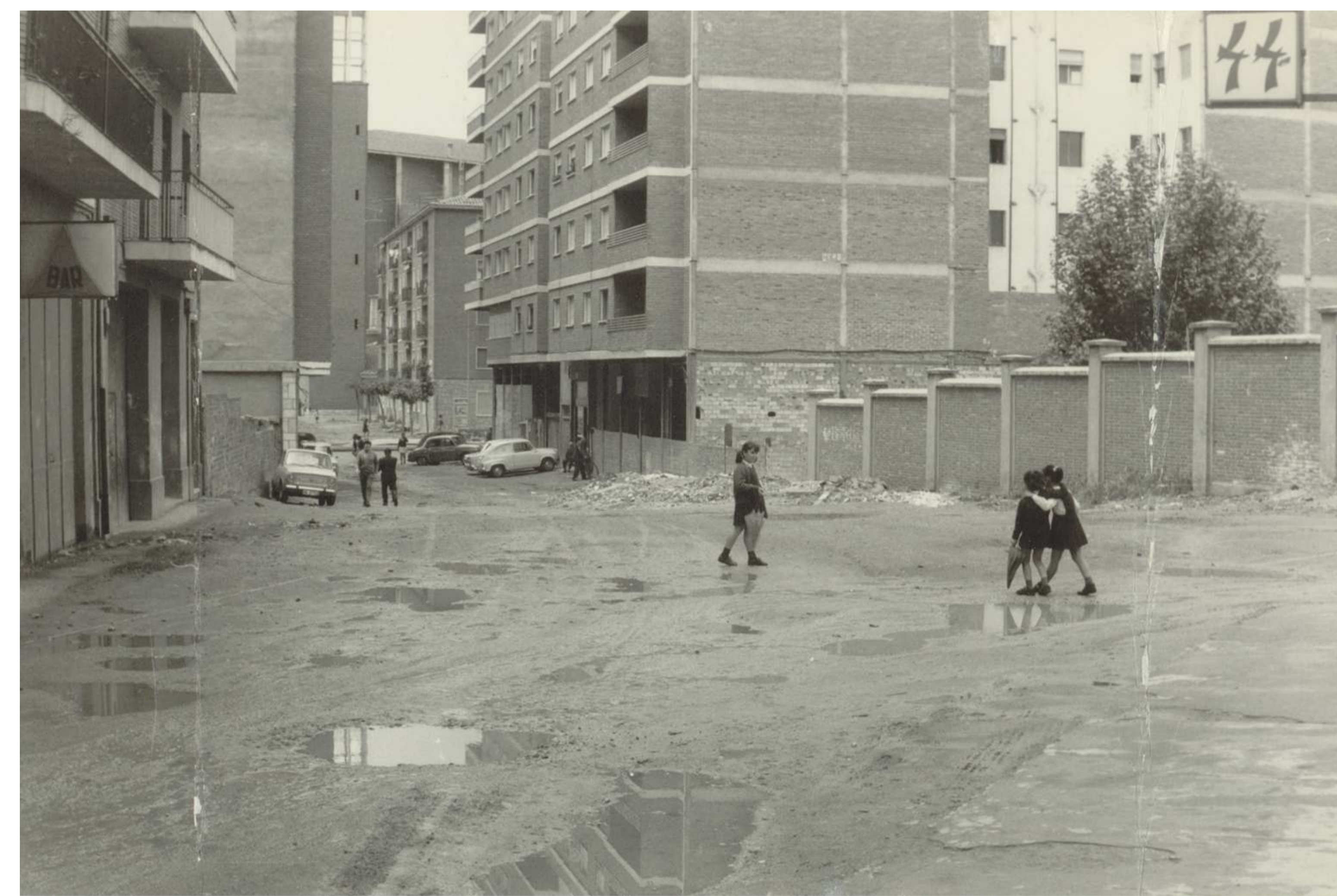
La calle Goya todavía sin pavimentar. 197? F 680-1