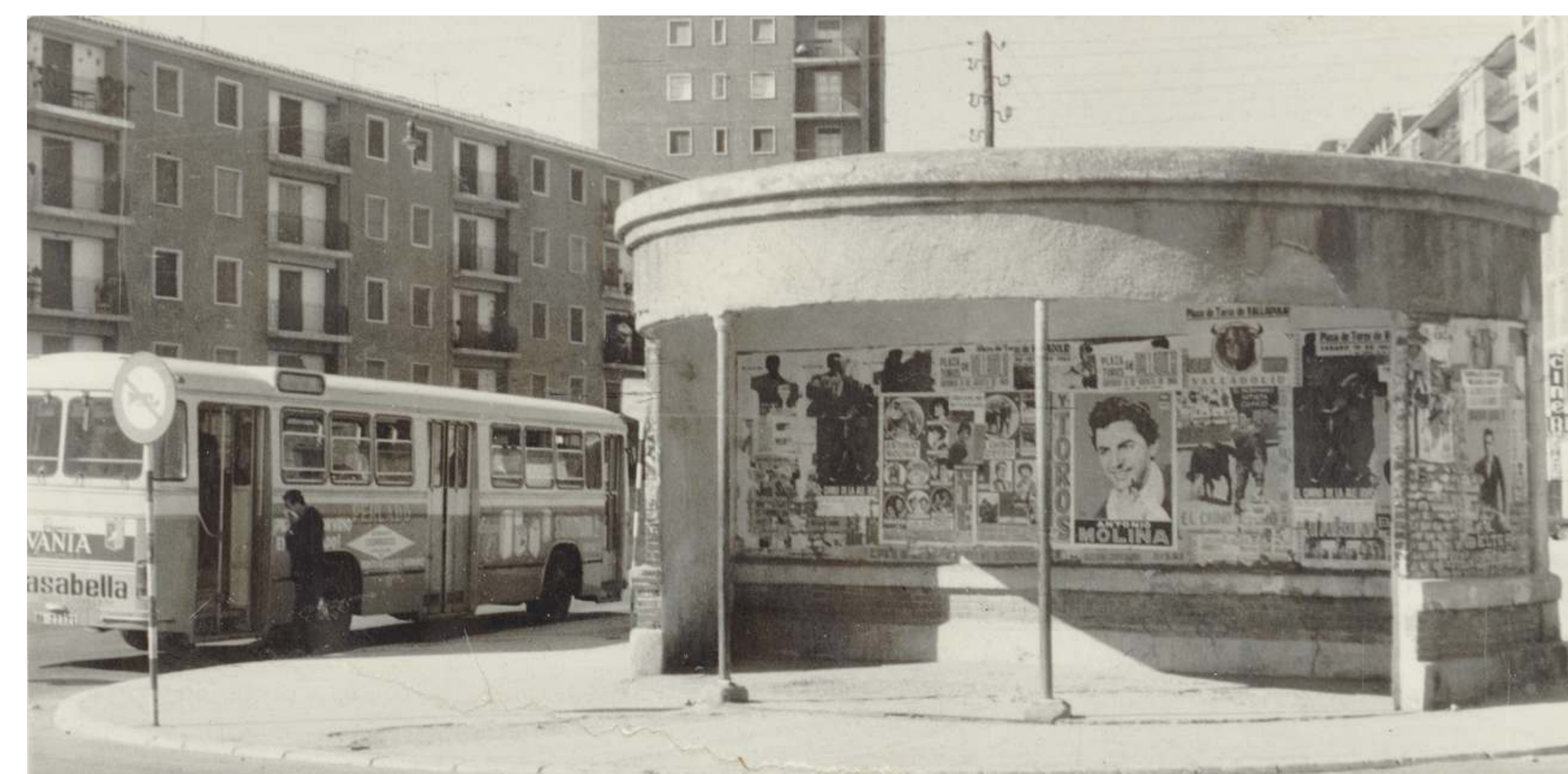
Marquesina en la esquina del paseo de Zorrilla con carretera de la Esperanza. 197? F 859-10

E l barrio del Cuatro de Marzo se sitúa entre el paseo de Zorrilla y el río Pisuerga, con el antiguo matadero, que venía prestando servicio desde el año 1936, como foco de actividad económica más importante de la zona. Se trata de un polígono de casi dos mil viviendas de protección oficial que se inauguró en el año 1960. Su nombre hace referencia a la fusión de Falange Española, fundada por José Antonio Primo de Rivera, con las JONS (Juntas de Ofensiva Nacional Sindicalista), fundadas por Onésimo Redondo. Casi todas las calles llevan nombre de compositores españoles.