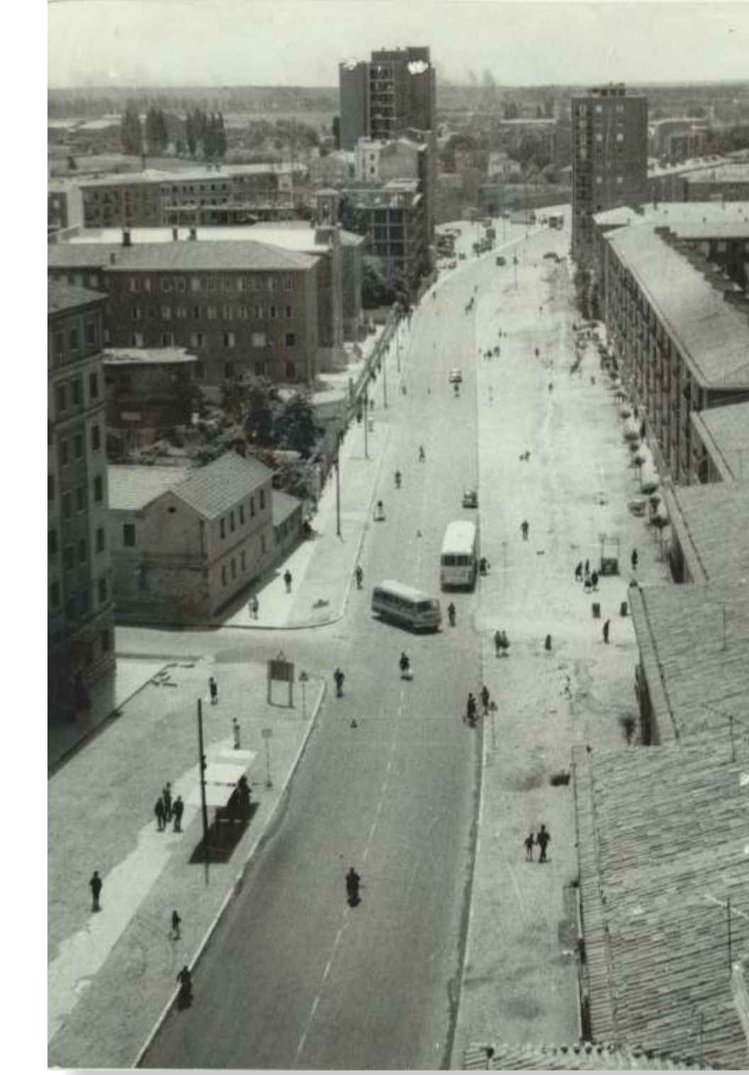
El paseo de Zorrilla desde el norte. ¿1970? F 358-2