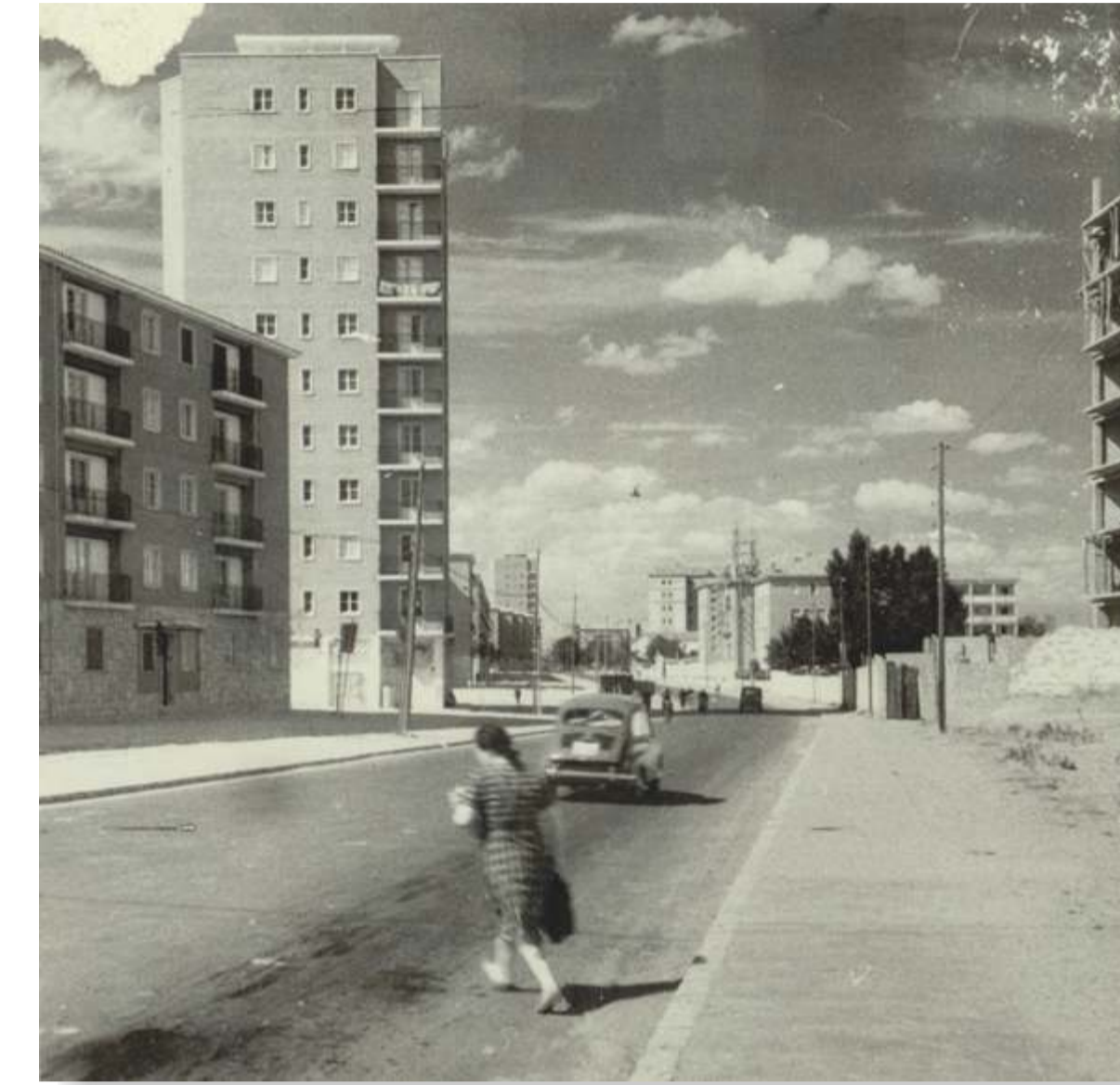
Vista del Cuatro de Marzo desde el paseo de Zorrilla, con el Sanatorio del doctor Quemada al fondo. 196? F 329-1