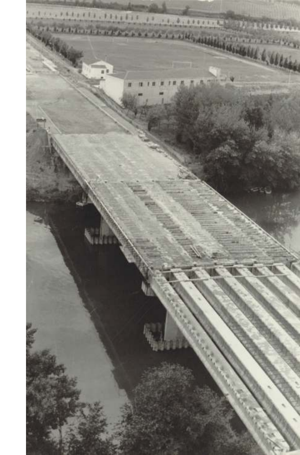
El puente de Arturo Eyries en construcción. ¿1971? F 876-2