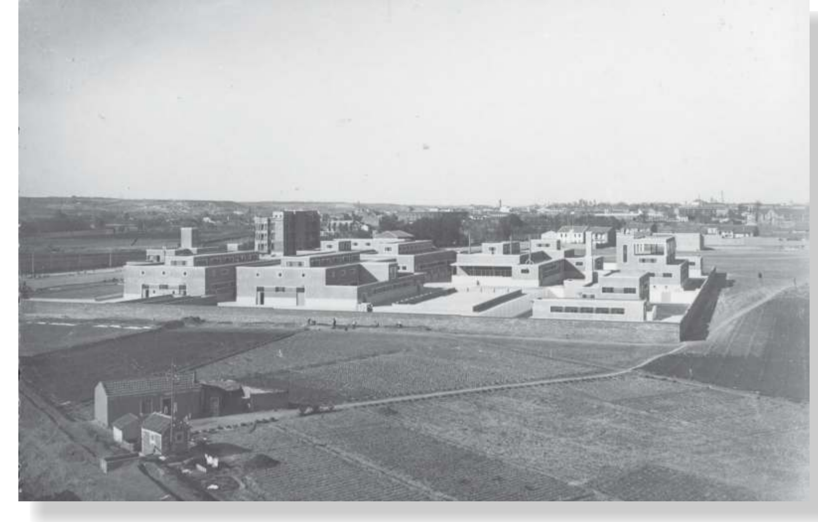
Tierras de labor entorno al matadero municipal. 1937? C. 767-1(14)