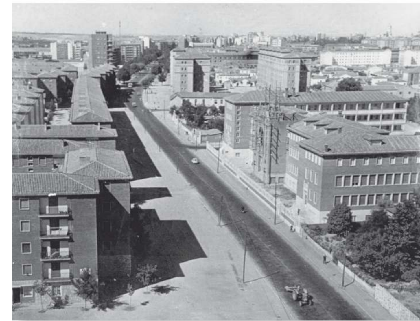
Paseo de Zorrilla desde el Cuatro de Marzo. A la derecha, el colegio Sagrado Corazón. 196? F 330-3