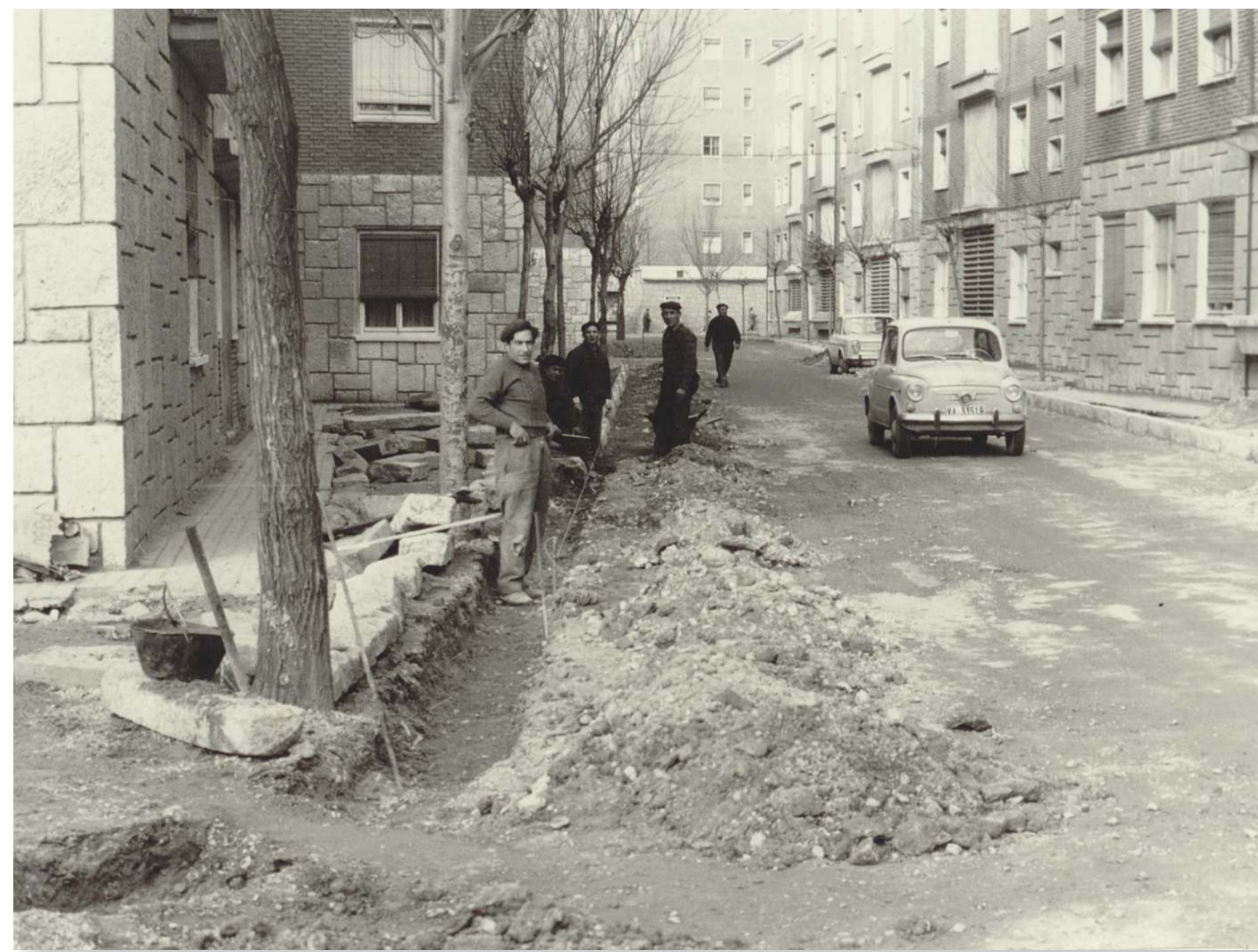
Acondicionamiento de calzada y aceras en la calle Granados. 197? Fondo Asociación de la Prensa. F 681-1