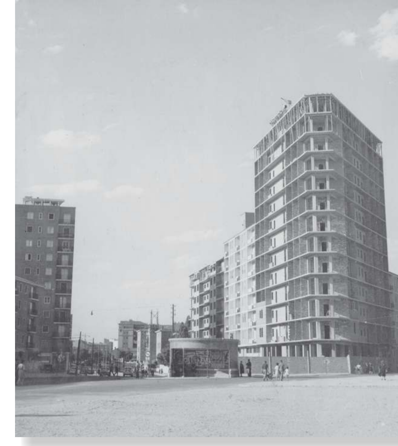
Esquina del paseo de Zorrilla con la carretera de la Esperanza. 196? Fondo Asociación de la Prensa. F 332-1