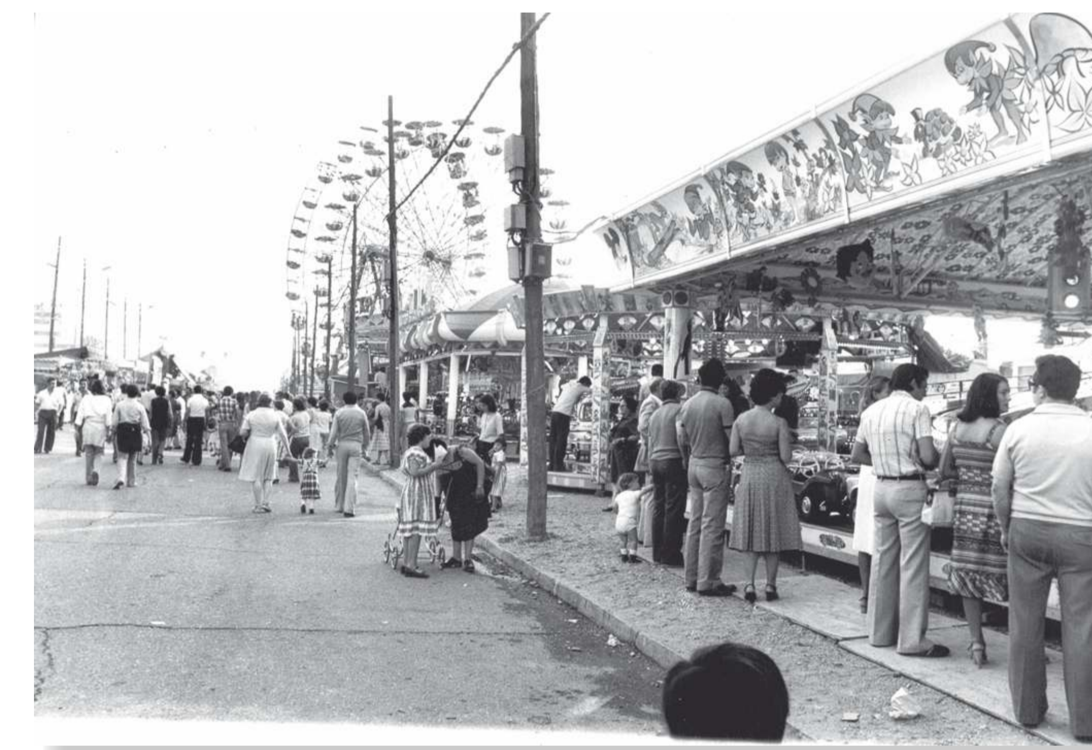
Niños (pequeños y grandes) siempre en el corazón de la feria. 197? F 543-27