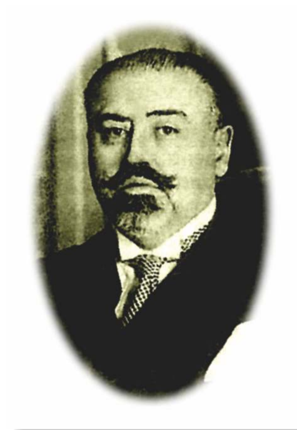
Santiago Alba y Bonifaz (1872 - 1949). Abogado, concejal del Ayuntamiento de Valladolid, diputado en Cortes y ministro en varias carteras.