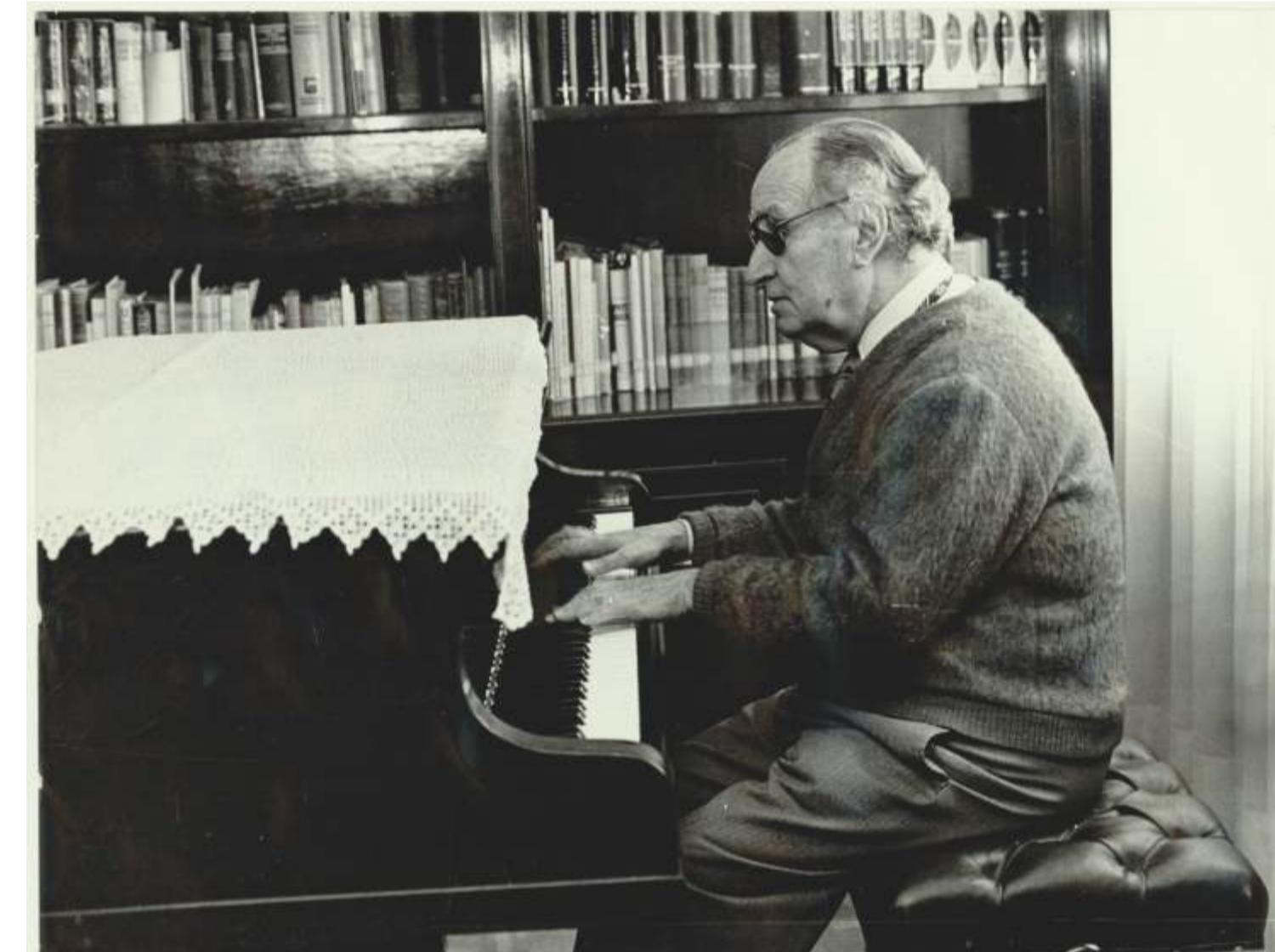
Joaquín Rodrigo (1901 - 1999). Compositor y Premio Nacional de música en 1983.