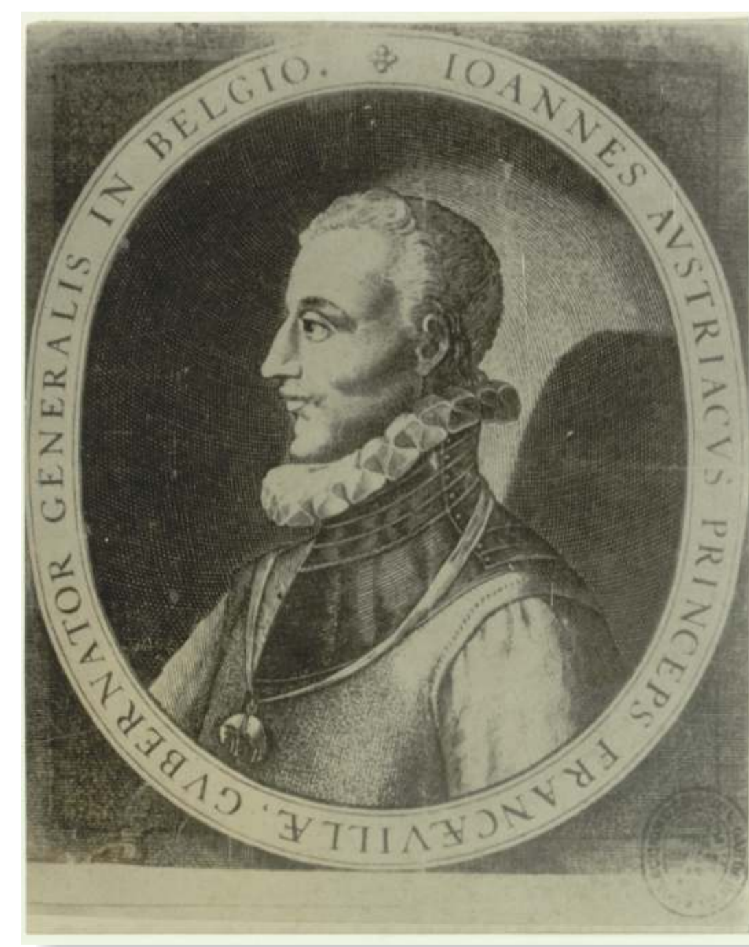
Juan de Austria (1547 - 1578). Hijo ilegítimo de Carlos I, Gobernador de los Países Bajo-españoles.

El callejero de las ciudades rinde homenaje a las personalidades ilustres, locales o nacionales, que a lo largo de la historia destacaron en cualquier campo del conocimiento. En las calles de la Zona Sur se pueden encontrar nombres de músicos, médicos, empresarios, toreros y escritores, cuya trayectoria profesional se mantiene viva en la memoria colectiva de los vallisoletanos.