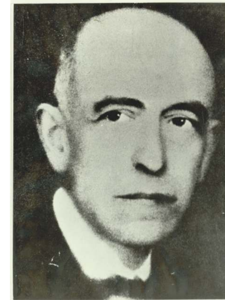
Manuel de Falla (1876 - 1946). Junto a Albéniz, Turina, Granados y Rodrigo, forma parte del grupo de grandes compositores españoles del siglo XX.