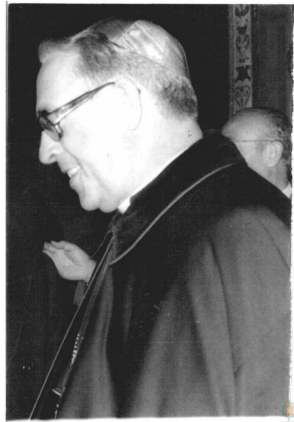
Marcelo González (1918 - 2004). Arzobispo de Barcelona, de Toledo y cardenal primado de España.