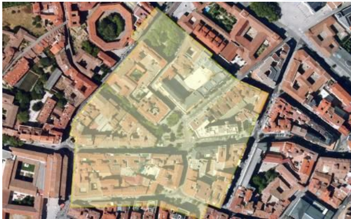
ZAS N2 – SAN MIGUEL