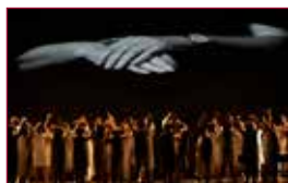
23 Bacanal, días de mostazas y kétchup – La nave senior