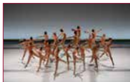
31 La Pastorale – Malandain Ballet de Biarritz