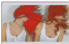
34 Mujercitas (en palabras de Jo)