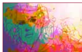
13 El jardín de las Hespérides