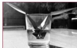
21 La gaviota