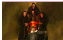
20 Andanzas y entremeses de Juan Rana