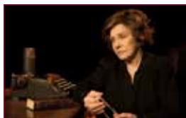
32 Cinco horas con Mario