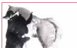
27 Peribáñez y el comendador de Ocaña