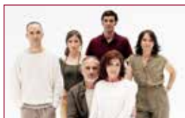
36 Las cosas que sé que son verdad