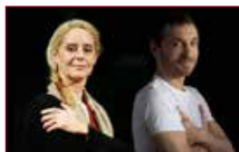
35 Pedro Páramo