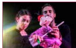
17 Trash/La poubelle plus belle