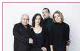
25 Las criadas