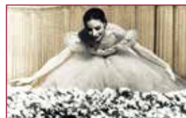
37 Gala centenario Alicia Alonso