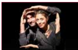
24 Talleres último trimestre 2020