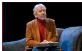
16 Señora de rojo sobre fondo gris