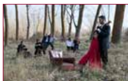
11 Soy como un árbol... que crece donde lo plantan