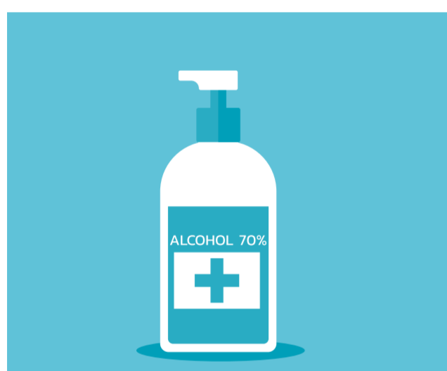
Haga uso del gel hidroalcohólico a su disposición.