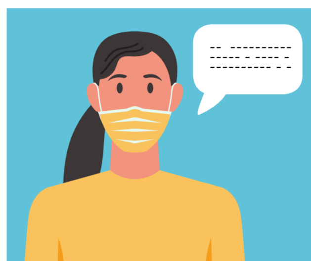
Siga las instrucciones del personal en todo momento.