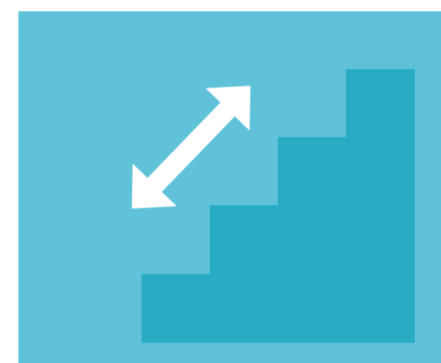
Utilice las escaleras. El ascensor solo puede ser usado por una persona.

HORARIO | Bibliotecas Municipales: Lunes a viernes: 9:30 - 13:30 h Puntos de Lectura: Lunes a viernes: 11:30 - 13:30 h