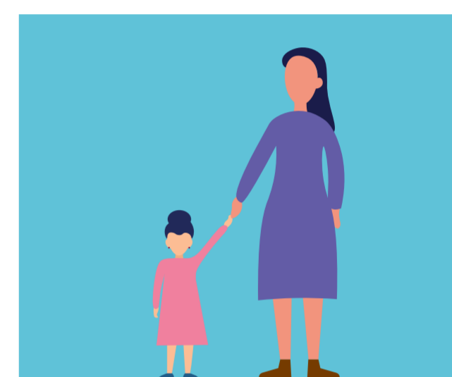
Menores de 14 años acompañados.