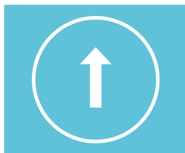
Circule únicamente por las zonas permitidas.