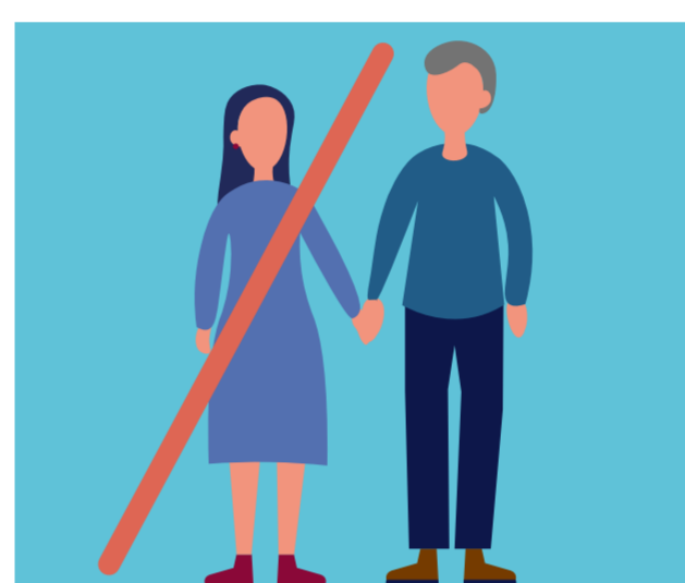
Se recomienda acudir solo o sola.