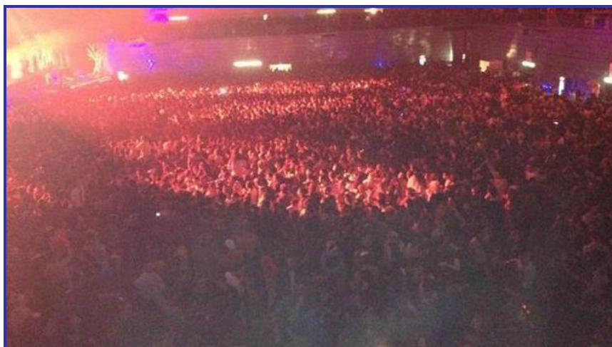
Exceso de aforo