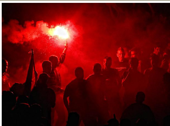
Uso de productos pirotécnicos