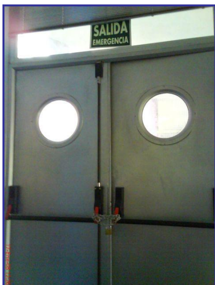
Puertas de emergencia cerradas