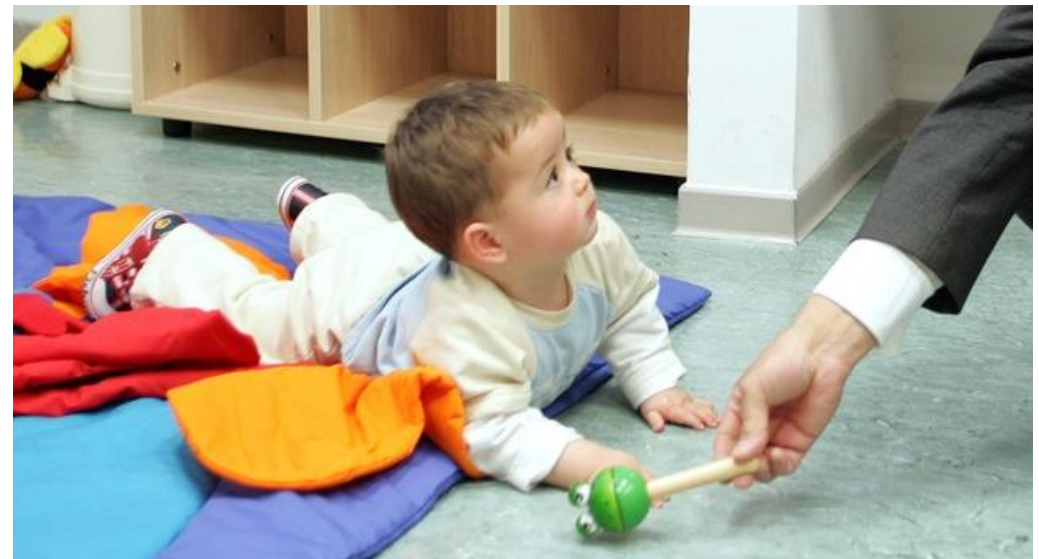
Escuela infantil “El Principito”