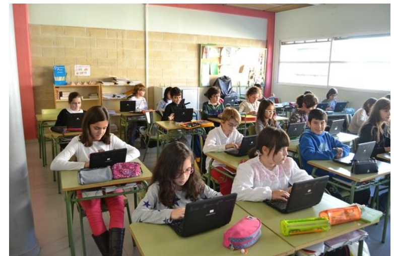
CEIP Cardenal Mendoza

n) Participar en la vigilancia del cumplimiento de la escolaridad obligatoria y cooperar con las Administraciones educativas correspondientes en la obtención de los solares necesarios para la construcción de nuevos centros docentes . La conservación, mantenimiento y vigilancia de los edificios de titularidad local destinados a centros públicos de educación infantil , de educación primaria o de educación especial .