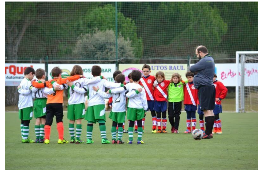
Partido de alevines en el Hermanos Lesmes