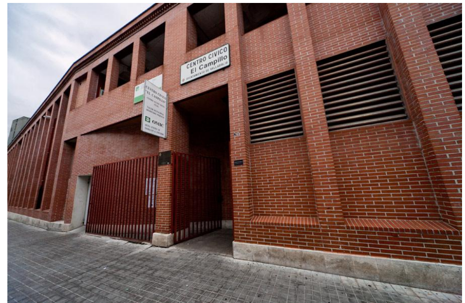
Centro Cívico El Campillo

•Completar la red con el Centro Cívico de la Zona Centro . Puede haber tres alternativas , trasladar la OMIC del Campillo al edificio del área, y ampliar el centro, o trasladar el centro a la Casa Revilla, trasladando la sede de la Fundación de Cultura al edificio de la Casa Consistorial o San Benito o negociar con la administración educativa el traslado del IES Escuela de Artes al antiguo IES Santa Teresa, en estado de abandono.