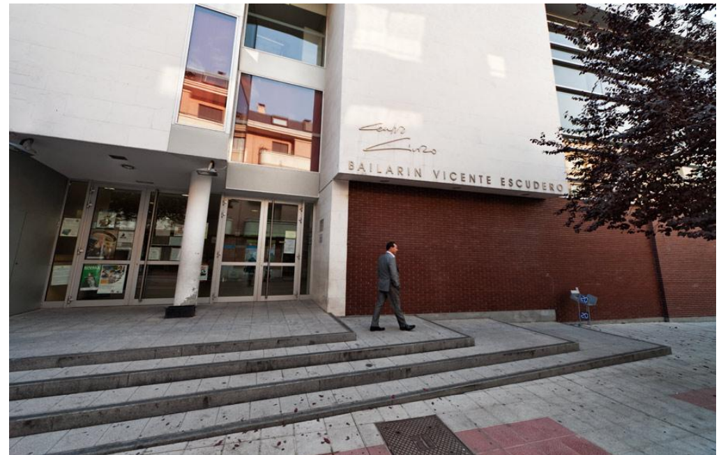
Centro Cívico Bailarín Vicente Escudero